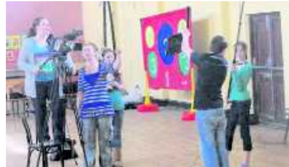
Spórt agus spraoi: I mbun scannánaíochta i gColáiste Riocaird Bairéid agus i mbun peile i gColáiste Bhaile Bhuirne

Tá coláistí eile ag díriú ar réimsí éagsúla a mbíonn an-rath orthu mar a dhéanann Coláiste Lurgan a dhíríonn ar chúrsaí teicneolaíochta agus amhránaíochta, Coláiste Riocaird Bairéid de chuid Ghael Linn i gCo Mhaigh Eo, a réachtálann gearrchúrsa scannánaíochta